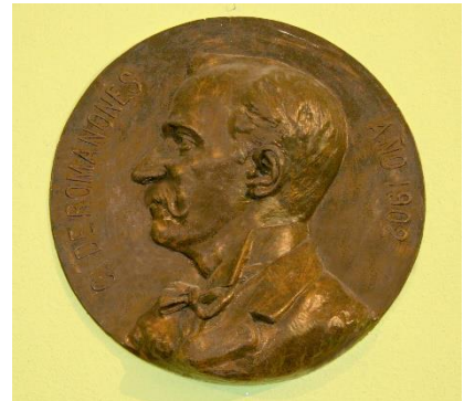
Conde de Romanones