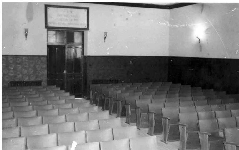
Fotografía antigua del Paraninfo (~1960)

El paraninfo del Instituto Zorrilla es un lugar bien conocido de todos los miembros de nuestra Asociación y de los profesores y miles de alumnos que, a lo largo de su historia, han pasado por el centro.