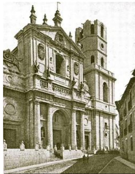
Fotografía correspondiente a 1890.

Tras varios proyectos presentados por varios arquitectos, en 1862 se forma un equipo de arquitectos bajo la dirección de Antonio Iturralde, pero no se pudo hacer nada por falta de presupuesto. En 1878 se decide construir la torre en el lado de la Epístola. De nuevo bajo la dirección de Iturralde, siguiendo en parte el proyecto de 1862. Las obras se iniciaron en 1880 y concluyeron (o eso se creía) en 1885. Pero las críticas sobre la altura de la torre y su falta de esbeltez, impulsaron rápidamente a una modificación consistente en añadir dos pisos más (uno para el reloj) y una nueva sala de campanas, ya que la baja altura del proyecto inicial impedía oír a las mismas. Tras solventar diferentes problemas, la obra finalizó en 1890.